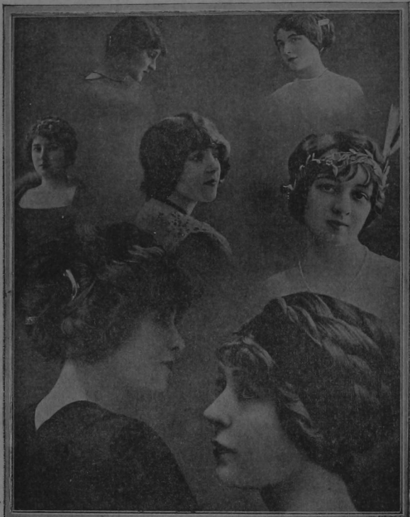
Nuestras bellas lectoras escogerán de seguro para Las Fiestas algunos de los peinados que hoy reproducimos, tomados de «Feminas». He aquí la descripción de los mismos:

PARTE SUPERIOR: A LA DERECHA: Peinado plano con carrera de lado y los cabellos apretados muy bajo sobre la nuca.